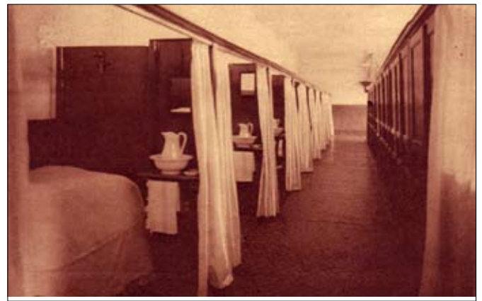
De slaapzaal met de bijborende 'chambrettes'