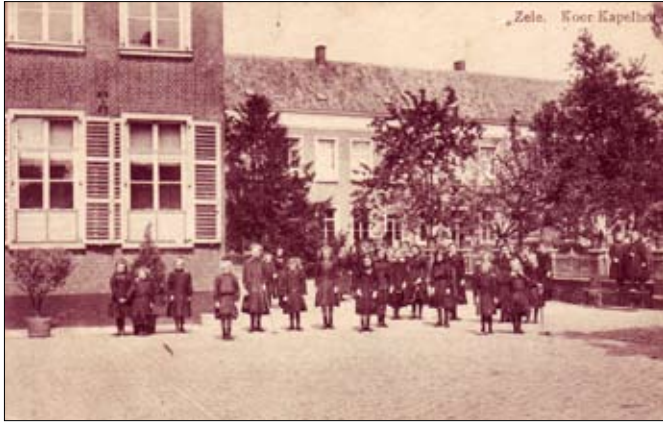
De koer (1925). Bemerkt het bekkenwerk dat de twee speelplaatsen afbakende.

Stuk voor stuk pareltjes, getuigen van een brok onderwijsgeschiedenis.