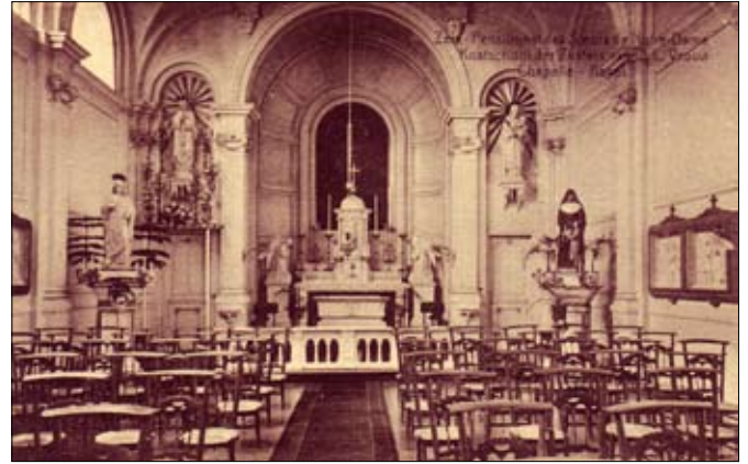
De kapoel van de school